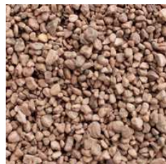
NOCCIOLINO DI SANSÀ POMACE